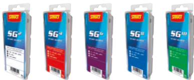
Start SG luistovoiteet