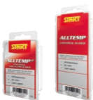
Start Universal luistovoiteet

Lämmittäminen lisää voiteen kulutuskestoa ja siksi lämpövoitelua suositellaan etenkin pitkille hiihtomatoille (yli 10 km).